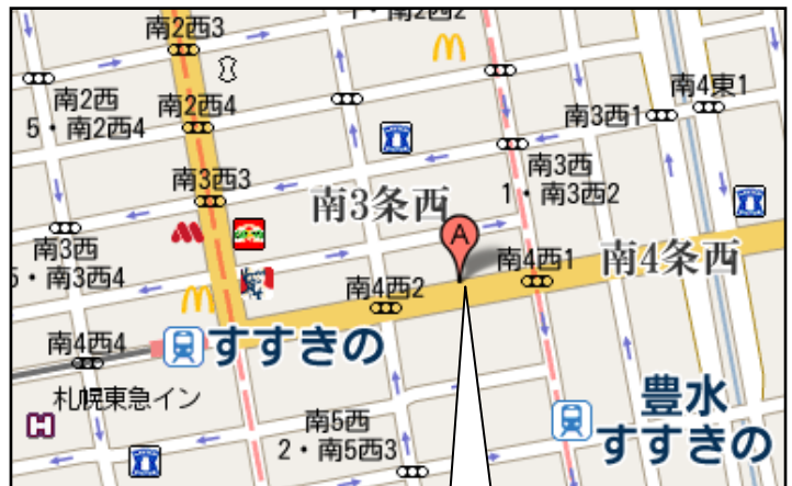
ススキノグリーンホテル1 周辺地図