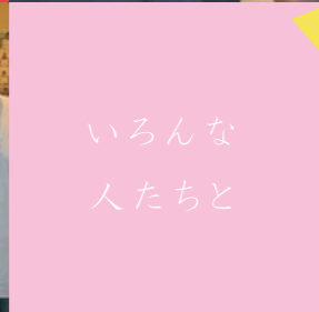
いろんな人たちと