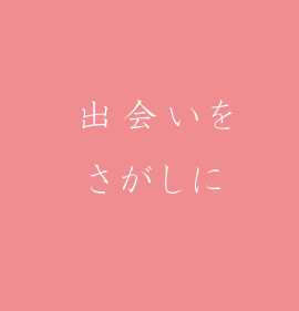
出合いをさがしに